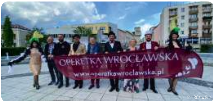
fol. RCK w Piła

Warto wspomnieć, że w ostatnim czasie Miejski Zakład Gospodarki Mieszkaniowej przeprowadził remonty 10 kamienic i ponad 80 lokali mieszkalnych. łączny koszt tych inwestycji przekroczył 15 milionów złotych.