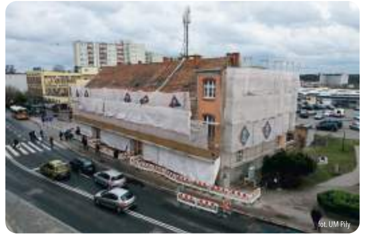
fol. UM Piła

W ramach tego projektu dawny blask odzyska także sąsiadujący z budynkami park. Odnowione zostaną alejki spacerowe, pojawiają się